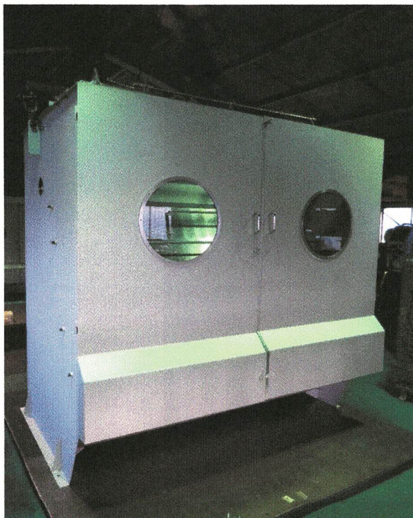
ボックスタイプ・洗浄装置付きモデル